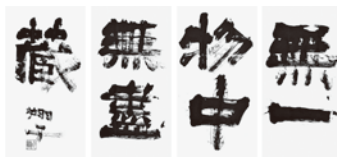
《無一物中無盡蔵》2015年